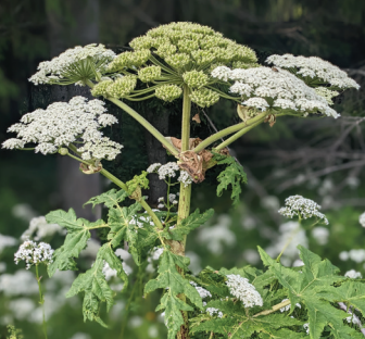
Berce du Caucase