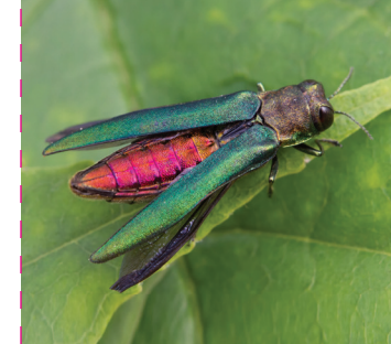
Agrile du frêne

La prévention est essentielle pour empêcher que ces espèces se répandent.