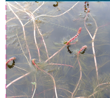
Myriophylle à épis