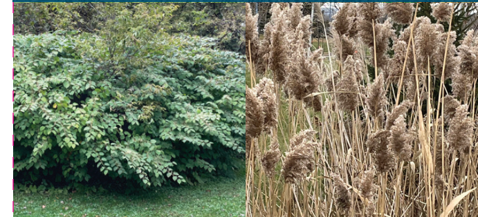
Renouée du Japon